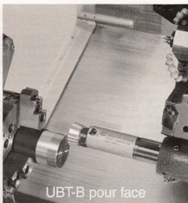
UBT-B pour face