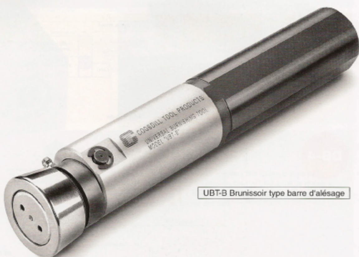
UBT-B Brunissoir type barre d'alésage