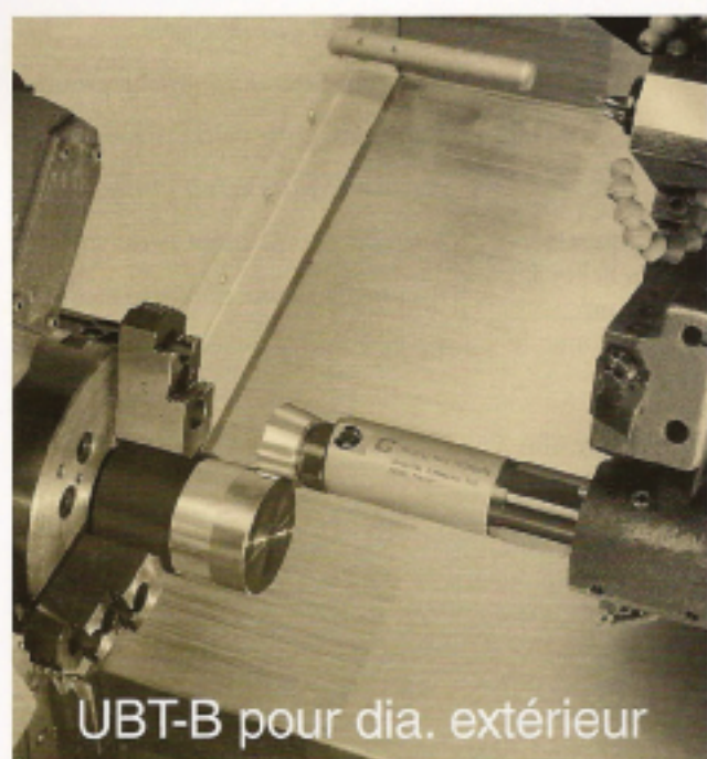
UBT-B pour dia. extérieur