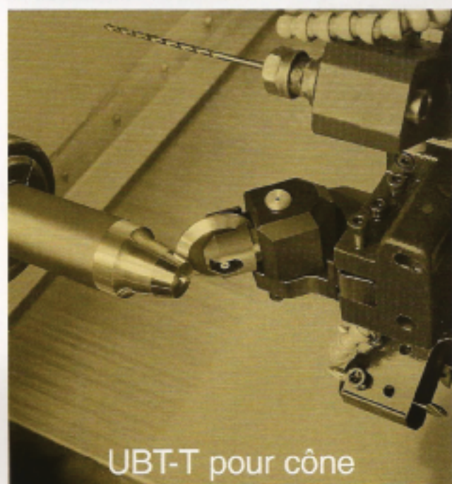
UBT-T pour cône